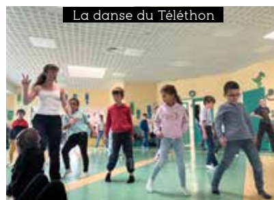
La danse du Téléthon