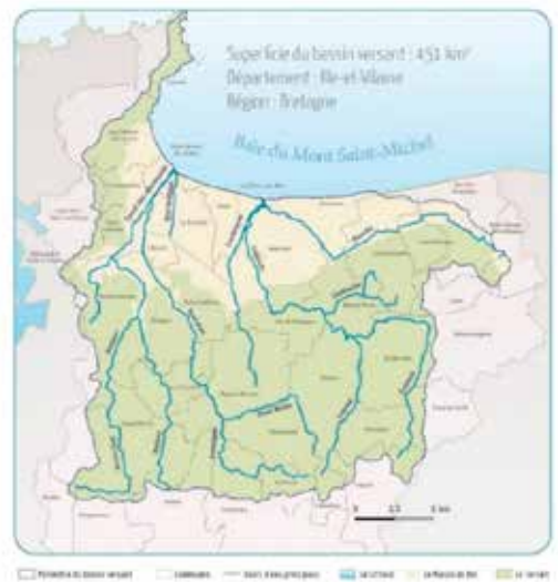
Les bassins côtiers de la région de Dol de Bretagne

des zones humides favorisent la résilience des rivières, jouant un rôle essentiel dans la réduction des risques d'inondation pour les habitations et les infrastructures en aval.