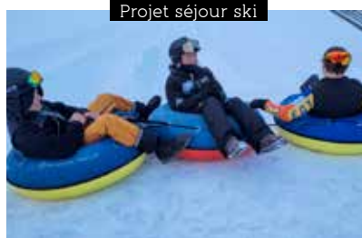
Projet séjour ski

Découverte de divers sports tout au long des 5 cycles : athlétisme, art du spectacle, sport de pleine nature pour les enfants de la petite section au CM2. Les séances ont lieu les mardis à la salle multisport de La ville es Nonais de 17h-18h et les mercredis à la salle de motricité de Saint-Père Marc en Poulet de 9h45-10h30, de 10h45-11h30 et de 16h45-17h