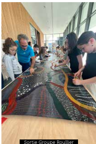
Sortie Groupe Roullier