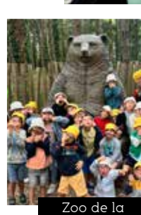
Zoo de la Bourbansais